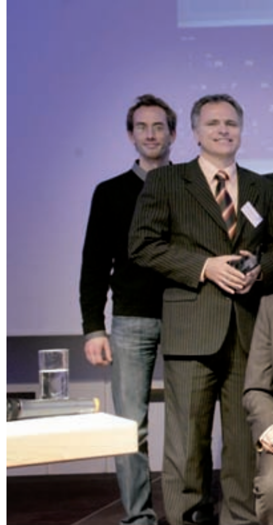
Die ausgezeichneten CyberChampions 2008 bei der Preisverleihung auf dem Trendkongress net economy in Karlsruhe

2. Platz: ontoprise GmbH, Karlsruhe - eine mehrfach patentierte Technologie, die es ermöglicht, gesammelte Unternehmensda-